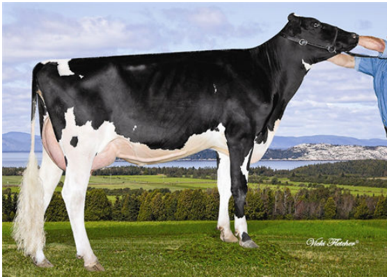
PARILE MAN O MAN LOVE Dam